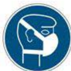
Leichten Atemschutz benutzen