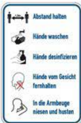
Abstand halten, Hände waschen,...