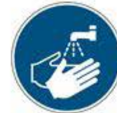
Hände waschen DIN EN ISO 7010-M011