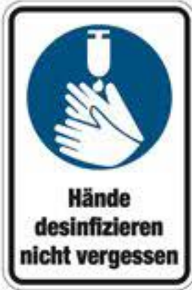
Hände desinfizieren nicht vergessen