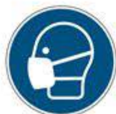
Maske benutzen DIN EN ISO 7010-M016