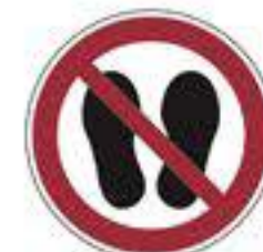
Betreten der Fläche verboten DIN EN ISO 7010-P024