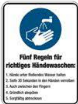
5 Regeln zum Händewaschen