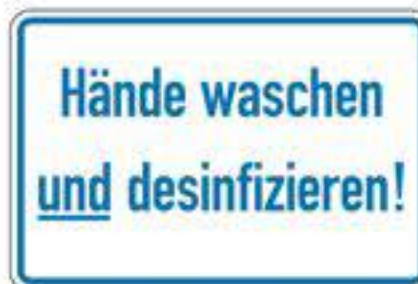
Hände waschen und desinfizieren