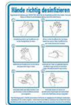
Hände desinfizieren gemäß DIN EN 1500